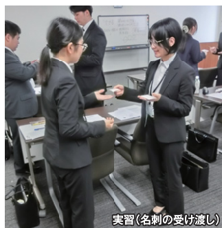
実習(名刺の受け渡し)