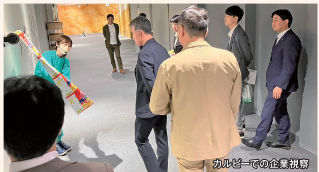
カルビーでの企業視察