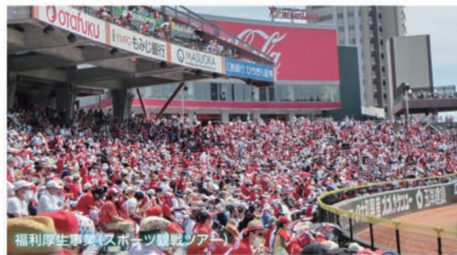
福利厚生事業(スポーツ観戦ツアー)