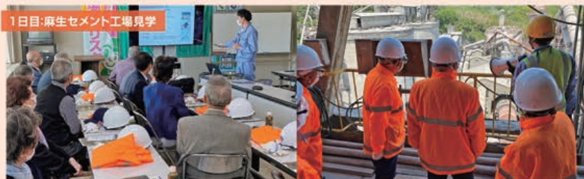
1日目:麻生セメント工場見学