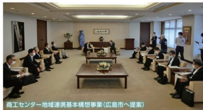
商工センター地域連携基本構想事業(広島市へ提案)

その地域経済サミットの一員として、MICE施設の誘致・整備を中心とした商工センター地区のまちづくりについて、広島市等と継続して議論していくとともに、引き続き、道路関係の要望活動の実施や地域防災・環境美化事業にも積極的に参加協力していくこととします。