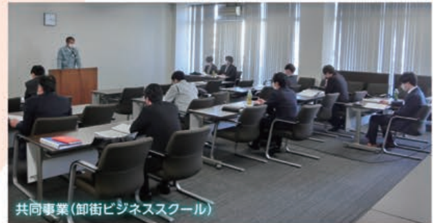
共同事業(卸街ビジネススクール)

また、パソコン実践力養成コースについては、従来のコース単位での受付のほか、講座単位毎の受講に変更して実施します。