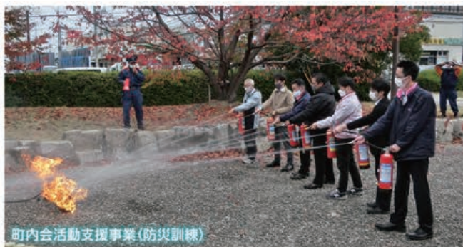
町内会活動支援事業(防災訓練)

町内会活動は、町内会の従業員間の交流、環境整備・防災対策など重要な役割を担っており、組合としては、継続して、自主的な運営のサポートを行うとともに、今後とも町内会からの意見を積極的に吸い上げ、行政へ直接要望を行うほか組合の各種事業に反映させていきます。