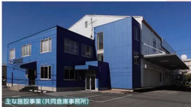
主な施設事業(共同倉庫事務所)