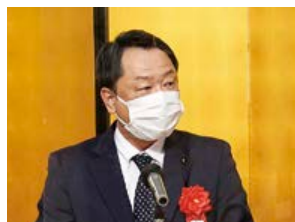
ご来賓 広島県議会議員 林 大蔵様