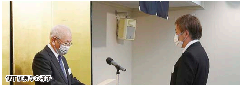
修了証授与の様子

スクールで得た知識や繋がりが、受講者及び各社の発展に留まらず、次世代の団地を担う人材育成になることを期待します。