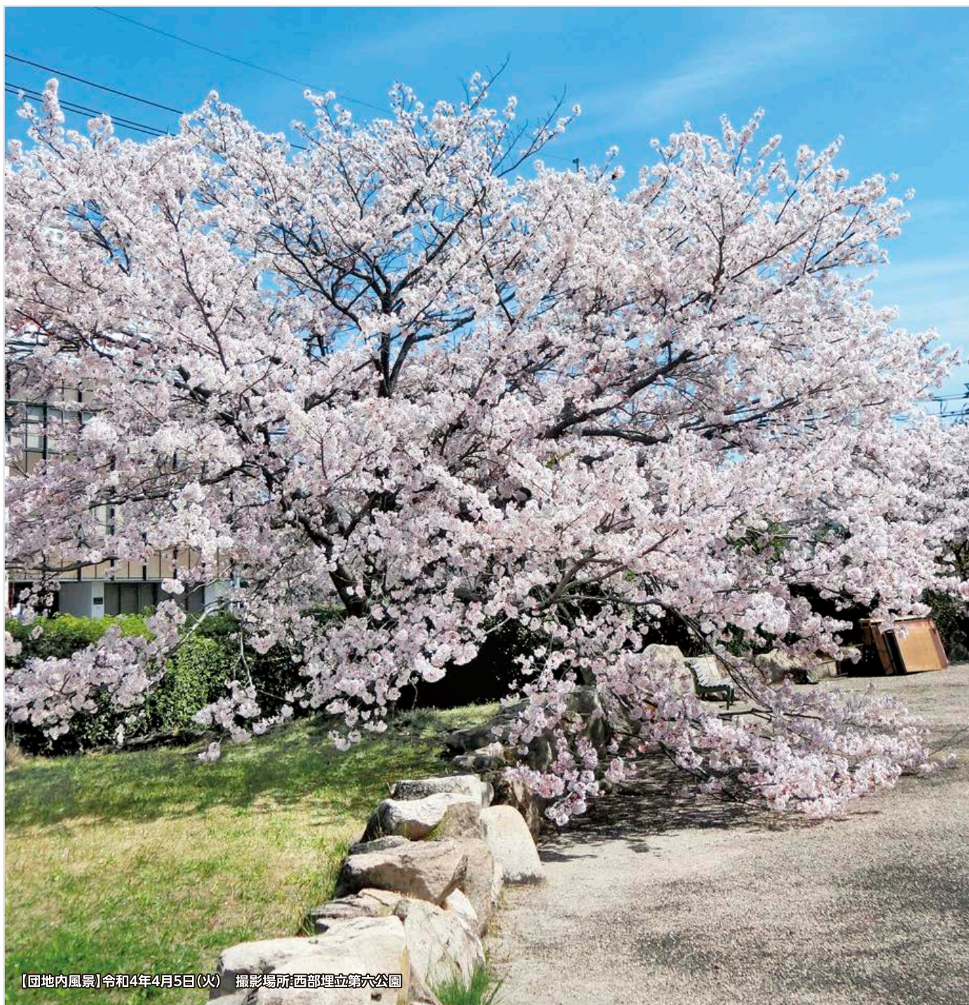
【団地内風景】令和4年4月5日(火) 撮影場所:西部埋立第六公園