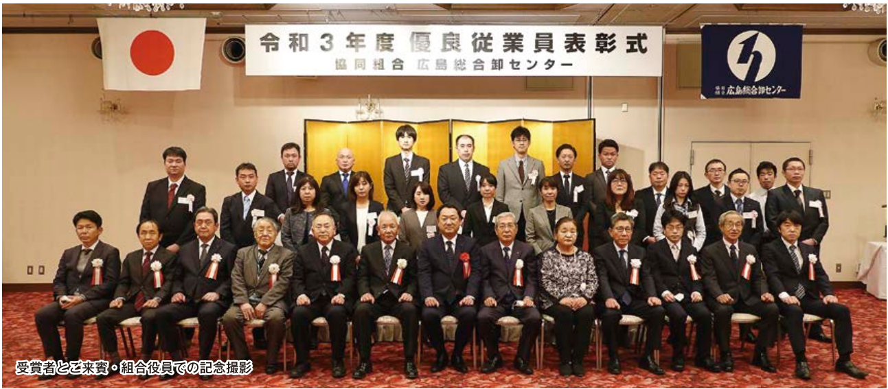
受賞者とご来賓・組合役員での記念撮影