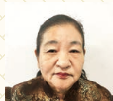
三光ホールディングス株式会社 代表取締役

新年あけましておめでとうございます。 先行予測不能な昨今、日々是好日としてすごせ ればと思います。 本年も宜しく願い致します。