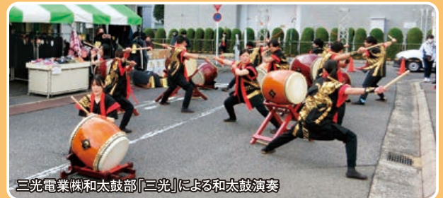
三光電業株式会社和太鼓部「三光」による和太鼓演奏