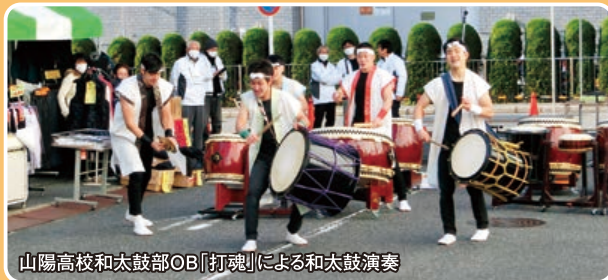
山陽高校和太鼓部OB「打魂」による和太鼓演奏