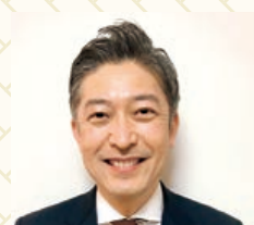
TOTO中国販売株式会社 代表取締役社長

明けましておめでとうございます。 2021年の「今年の漢字」は「金」でした。 2022年は寅の縞と番犬の色にあやかり「赤」では なく「黒」になりたい。