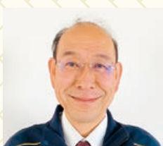
有限会社ダイエイ 代表取締役

明けましておめでとうございます。 思いっきり動ける環境に成りますように祈念します。 そして新しい事にチャレンジしたいと思います。 今年もよろしくお願いいたします。