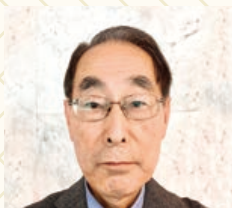
株式会社橋本商店 代表取締役社長

新年です!おめでとうございます。 昨年の後半、国外の新型コロナで減速しました。 今年は取り戻します。 皆さん今年もよろしくお願いいたします。