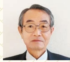
株式会社広厨 代表取締役社長

明けましておめでとうございます。 既存の価値観が揺さぶられる時代、新しい視点を 吸収するしなやかさが重要と思います。 本年もよろしくお願いいたします。