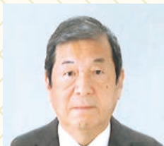
有限会社クロダソーイング 代表取締役

あけましておめでとうございます。 昨年以上に前向きにチャレンジ精神を強く持ち、 失敗しても何度でも挑戦していきたいと思っています。 本年もよろしくお願いいたします。