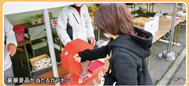
豪華景品が当たるガラポン