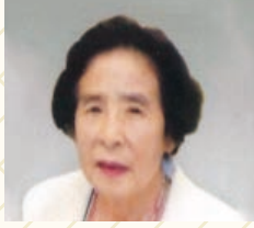
株式会社タカハシ 代表取締役