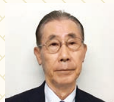
宝物産株式会社 代表取締役社長

明けましておめでとうございます。 本年は会社創業100周年の年です。 さらに前に向かって頑張りたいと思います。 皆様よろしくお願いいたします。