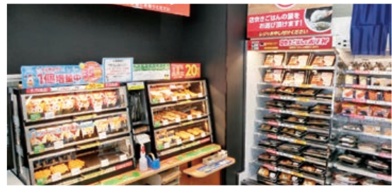
店内にはローソンの商品とポップ弁が並んでいます