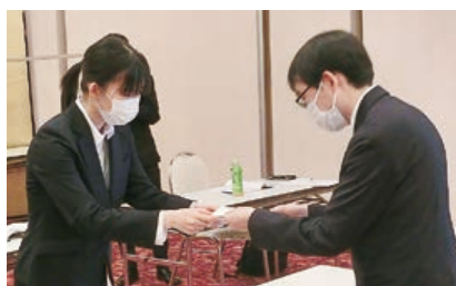
実習 (名刺の受け渡し)