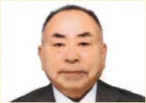
総務・財務委員長