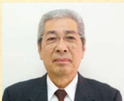
副理事長(資材部会長)