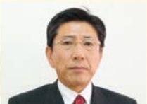
企画情報・広報委員長

コロナによる需要減速、売上げ減など卸街の企業にとっても経営環境は厳しくなりそうです。当委員会では、このような状況下で皆様に少しでも役立つような情報提供を企画して参りたいと考えています。本年も総務・財務委員会をご指導ご鞭撻の程、宜しくお願いします。