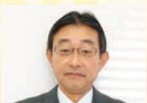
経営・共同事業等委員長

また、組合員の皆様に興味を持って読んで頂ける広報誌を目指し、各委員さんとともに頑張ってお参ります。本年も企画情報・広報委員会をよろしくご指導の程、お願い申し上げます。