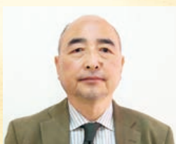
副理事長(繊維部会長)

卸センターでは、今後とも各組合員の企業への人材育成の支援事業や、各部会や町内会活動支援を通じて、様々な情報提供を行っていきます。また、国際見本市のできるMICEの誘致など地域の長期的発展に向けた活動も引き続き促進して参ります。最後に、組合員様のご発展と一日も早くコロナが収束してくれることを祈念して、新年のあいさつとさせていただきます。