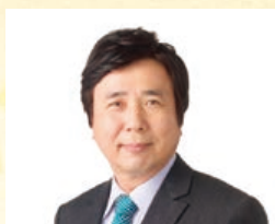
副理事長(雑貨部会長)

(協)広島総合卸センター各企業様に於かれまして今年が飛躍発展の始まりとなりますことを祈念し、新年のご挨拶といたします。