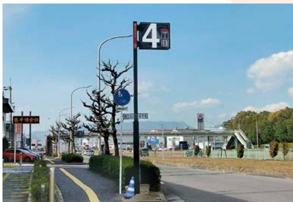
▲ 組合活性化事業(街区サイン)

分かり易いまちづくりを推進していくため、昨年度に続き、残りの12基の街区サイン(費用約5千万円)を団地周辺の道路上に設置します。