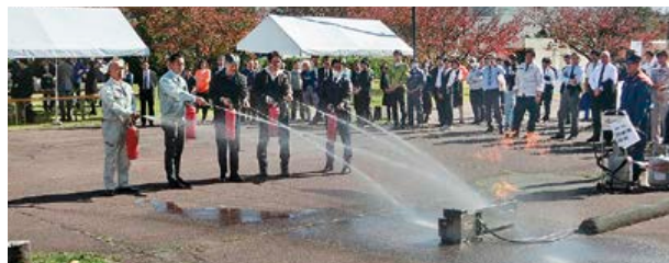
▲ 町内会活動支援事業(防災訓練)

町内会活動は町内会の従業員間の交流や、環境整備・防災対策等重要な役割を担っており、組合としては、継続して、自主的運営のサポートを行うとともに、今後とも町内会からの意見を積極的に吸い上げ、行政へ直接要望を行うほか各種事業に反映させていきます。