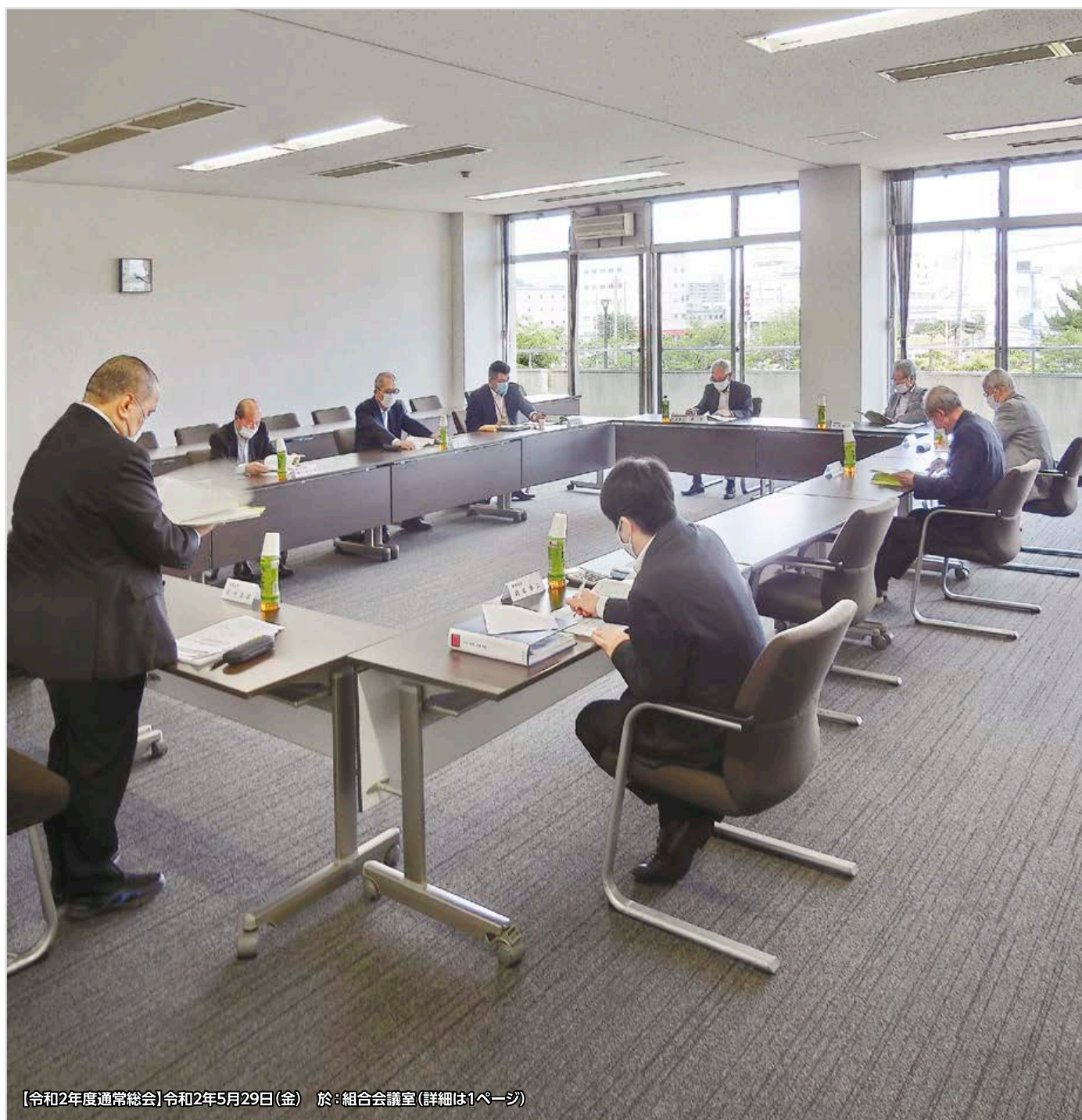
【令和2年度通常総会】令和2年5月29日(金) 於: 組合会議室(詳細は1ページ)