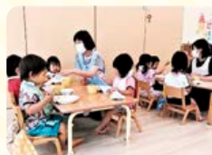
連携園で調理された国産材料中心の給食

(協)広島総合卸センターの組合員(従業員)の福利厚生の一環として設立された認可保育園です。3歳未満の保育を行っています。(組合員は保育料上限30,000円)