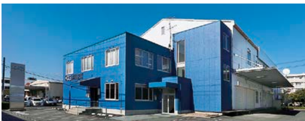
▲ 主な施設事業(共同倉庫事務所)