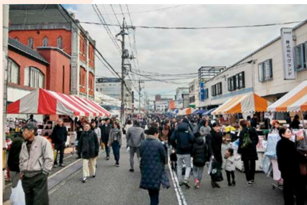
▲ Aゾーン街づくり推進事業(卸街まつり)

卸街まつりを盛大に実施することにより、地域と一体となったまちづくりを推進します。