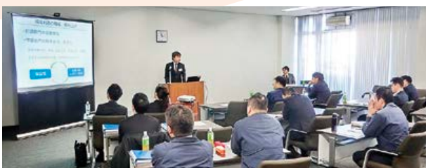
▲ 共同事業(卸街ビジネススクール)