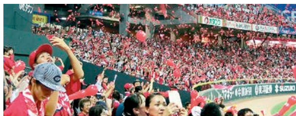
▲ 福利厚生事業(スポーツ観戦ツアー)