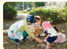
近くの緑道で季節を感じるどんぐり拾い