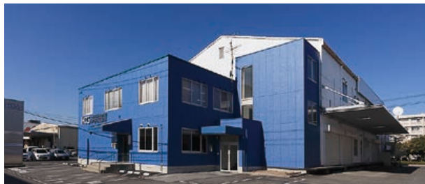
▲ 主な施設事業(共同倉庫事務所)