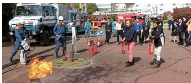
▲ 町内会活動支援事業(防災訓練)