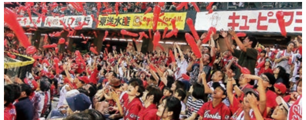
▲ 福利厚生事業(スポーツ観戦ツアー)