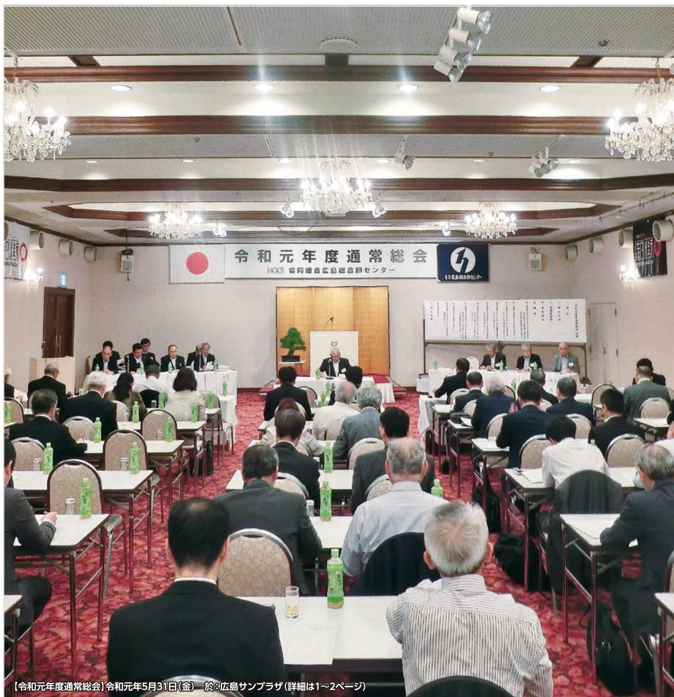
【令和元年度通常総会】令和元年5月31日(金) 於:広島サンプラザ(詳細は1~2ページ)