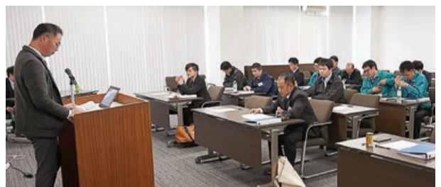
▲ 共同事業(卸街ビジネススクール)