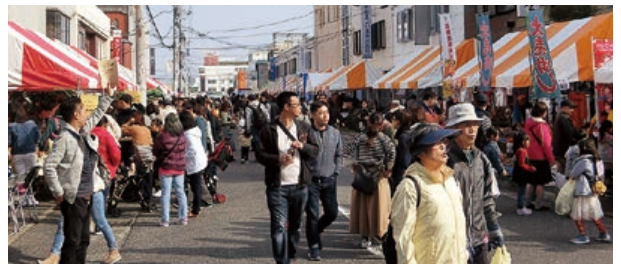
▲ Aゾーン街づくり推進事業(卸街まつり)