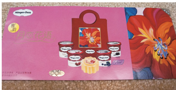
月餅券(ハーゲンダッツ)

中国で、最も人気のある月餅ブランドと言えば「杏花楼」です。1851年創業の老舗で、最も伝統的且つ一般的に親しまれているブランドです。杏花楼は、日本やアメリカなど海外にも輸出されており、最も有名で正統派の月餅ブランドと言えます。中秋節が近づくと、コンビニでも個包装で販売されていますので、中国に訪れた際、一度食べてみてください。